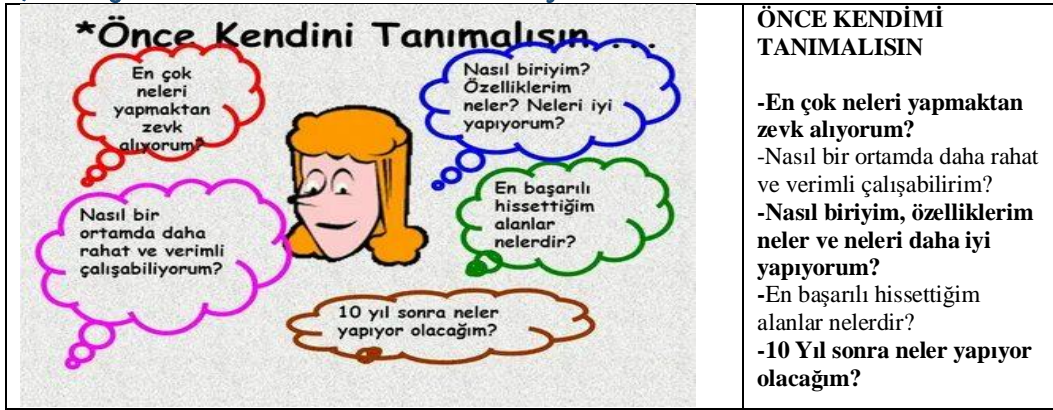
Şekil 2: İnsanın kendisini tanıması için oluşturduğu sorular