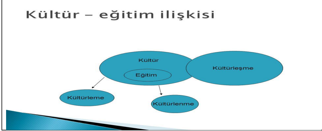
Şekil 4: Eğitim kültürün içinde ele alınarak, Kültürleşme, Kültürlenme ve Kültürleme kavramlarını kapsamaktadır.