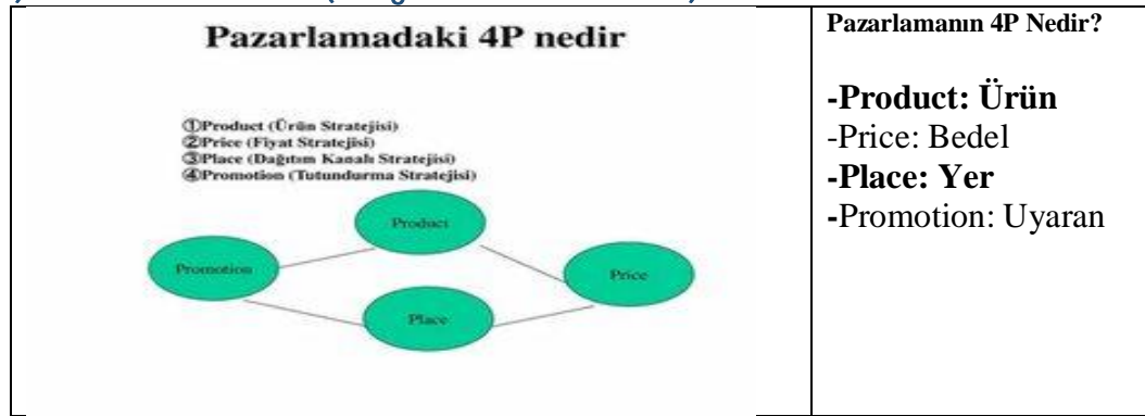
Şekil 3: Eğitimin bir cins ürün pazarlaması olarak ele alınması