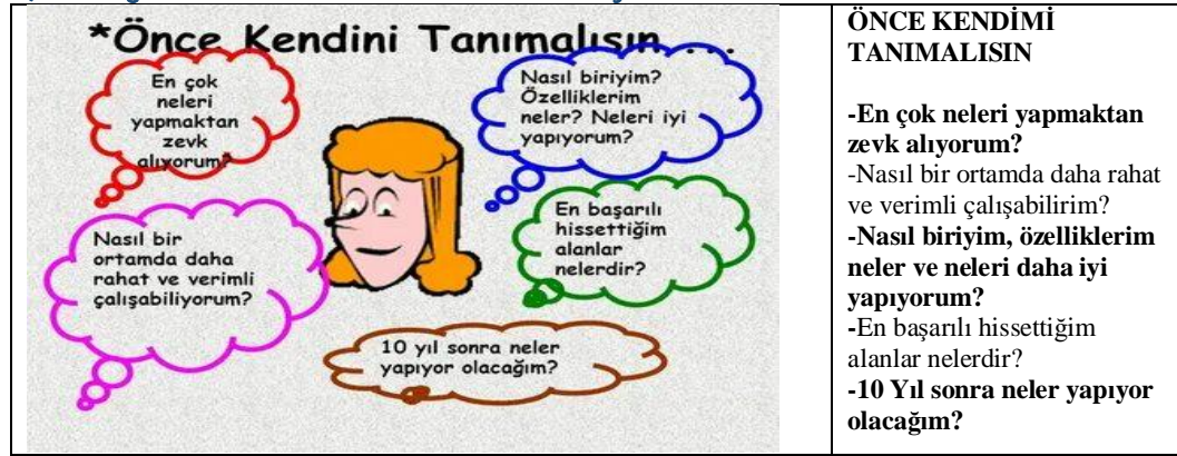
Şekil 2: İnsanın kendisini tanıması için oluşturduğu sorular