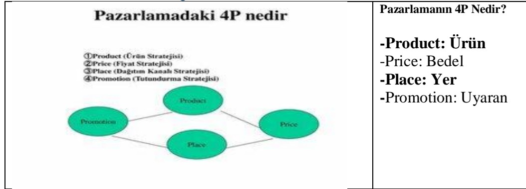
Şekil 3: Eğitimin bir cins ürün pazarlaması olarak ele alınması