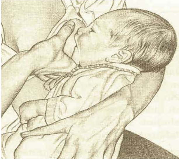
Şekil 6/15-1: Doğru Emzirme Tekniği

Bebeğin memeye yerleştirilmesi esnasında önce meme ucuyla bebeğin dudaklarına dokunulmalı, bebeğin ağızını genişçe açması beklenmeli, bebeği alt dudağı meme ucunun altına gelecek şekilde çabucak memeye tutmalıdır. (Şekil 1)