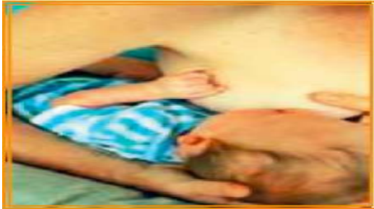
Şekil 6/15-5: Çanta Pozisyonu