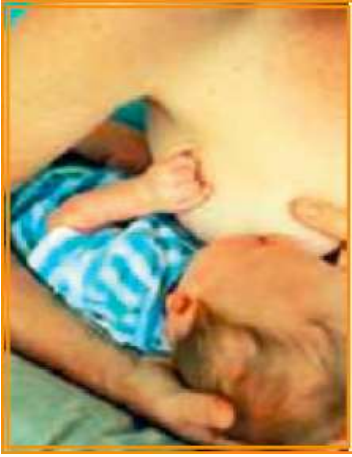
Şekil 6/15-5: Çanta Pozisyonu