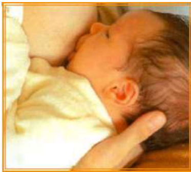
Şekil 6/15-3: Beşik Pozisyonu