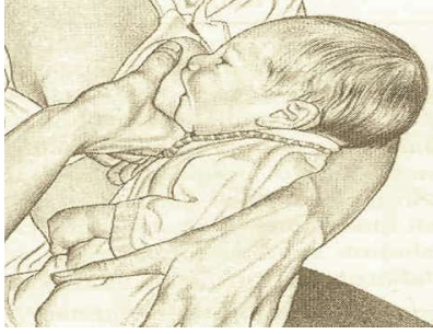
Şekil 6/15-1: Doğru Emzirme Tekniği