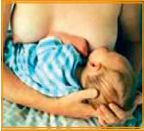
Şekil 6/15-4: Çapraz Beşik Pozisyonu