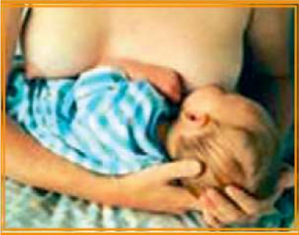
Şekil 6/15-4: Çapraz Beşik Pozisyonu

Diğer pozisyondan farklı olarak bebeğin başı annenin eline yaslanmaktadır. Eller dönüşümlü kullanılabilir. Bebek hangi taraftaki memeyi emiyorsa desteği diğer kol ve el verir. Emdiği tarafın eli başını tutarken diğeri sırtına destek verir. Başını tutan el sabit kalırken diğeri ile meme başını tutması ayarlanır. Bu pozisyon küçük doğmuş bebekler için uygundur. Meme başını kuvvetli tutamayan bebeklere daha yardımcı olmalıdır.