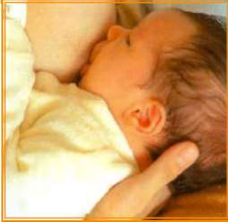
Şekil 6/15-3: Beşik Pozisyonu