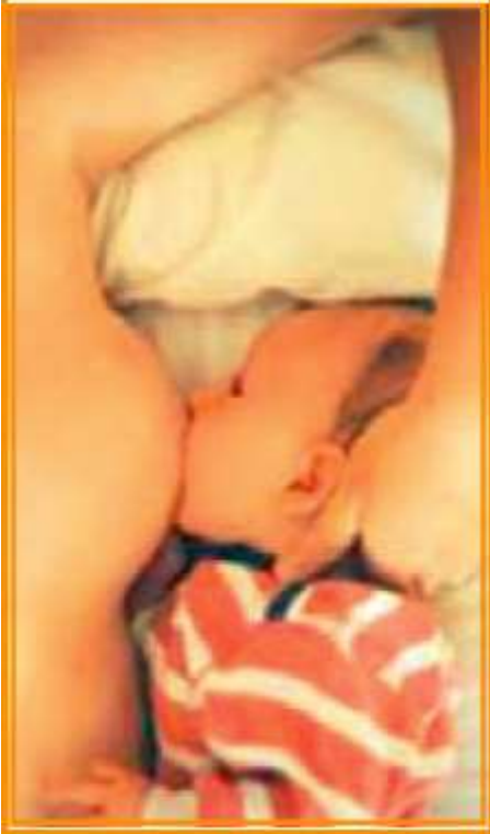
Şekil 6/15-6: Yatar pozisyon ile emzirme

Anne ve bebeğin her ikisinin de yattığı yerden emzirme durumudur. Anne yatakta sırt üstü yatmaktadır. Yatağın sırt tarafı yükseltilmiş veya yastıklarla kaldırılmış olmalıdır. Anne ayaklarını dizlerinden kırarak yatağa dayar. Bebeği de sol veya sağ yanına yan olarak yatırır. Bir eli ve kolu ile bebeğin başına destek verirken diğer kolu ile bebeğin sırt ve poposunu destekler. Annenin omzunun altına yastık koyması yararlı olur. Ayrıca bebeğin başının altına küçük bir yastık konulabilir. Dikkat edilmesi gereken konu bebeğin memeye uzanmasına gerek kalmaması ve annenin bebeğin üstüne doğru abanmamasıdır. Annenin yattığı yerden kalkmasının zor olduğu durumlarda veya yattığı yerden emzirmek istendiğinde uygulanabilir (7).