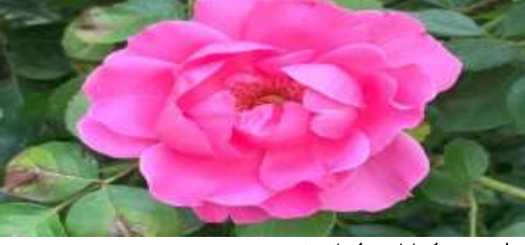
M. A. Akşit Koleksiyonundan