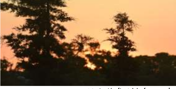
M. A. Akşit Koleksiyonundan