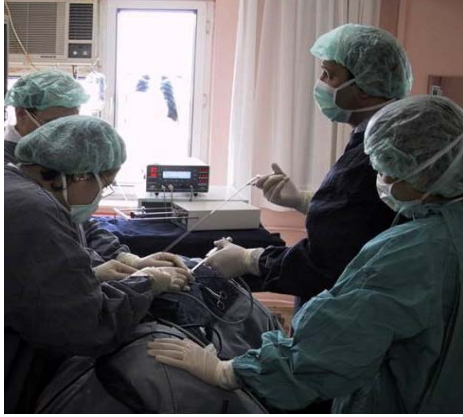
Resim 4. İşlem sırasında.