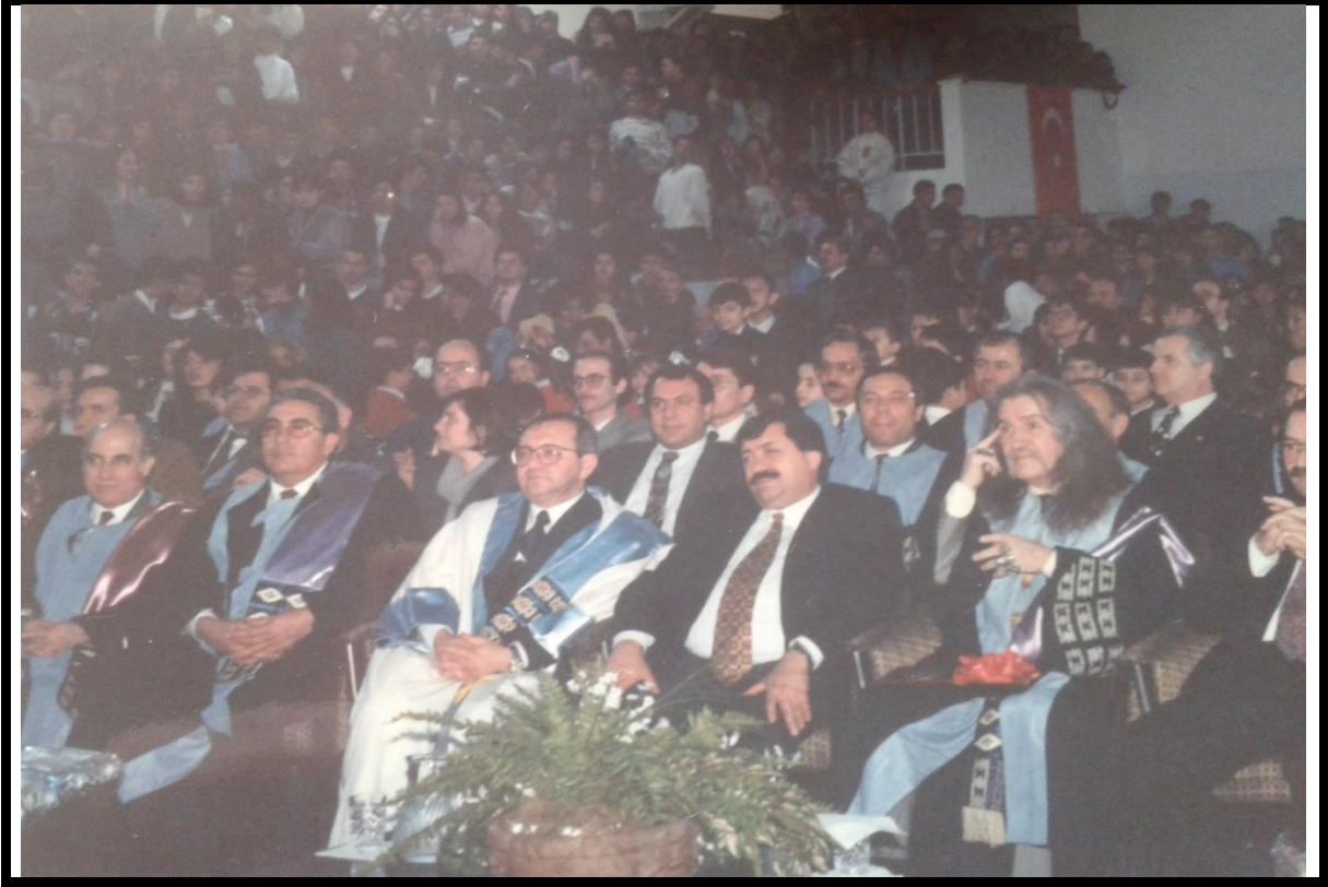
Şekil 3: Onursal Doktora Töreni; Rektör Yardımcısı, Eğitim Fakültesi Dekanı, Rektör, Vali, Barış Manço , Belediye Başkanı

Protokol sırasında Barış Manço 'nun yanında Vali ve Belediye Başkanına yer verilmiştir. Misafir eden olarak sağında ben olmam gerekirken, burada boyutu bir devlet adamı olarak nitelendirmesi açısından yapılmıştır. Kendisi bir Devlet Sanatçısıdır.