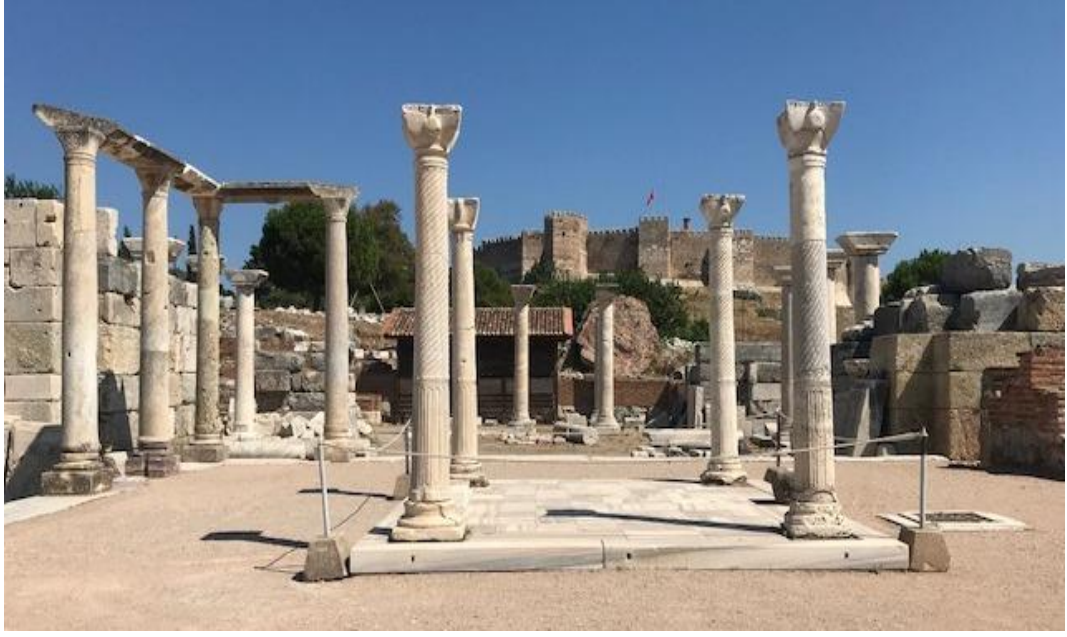
Şekil 1. Ayasuluk Tepesi, Selçuk, İzmir. Aziz Yuhanna'nın mezarı. Arka planda Selçuk Kalesi görünüyor (Not: Kendi çektiğimiz fotoğraflara ulaşamadığımdan internetten bir fotoğraf eklemek zorundayım.). https://www.arkeogezgin.com/ayasuluk-st-jean-kalesi/ (Erişim: 24.10.2020).