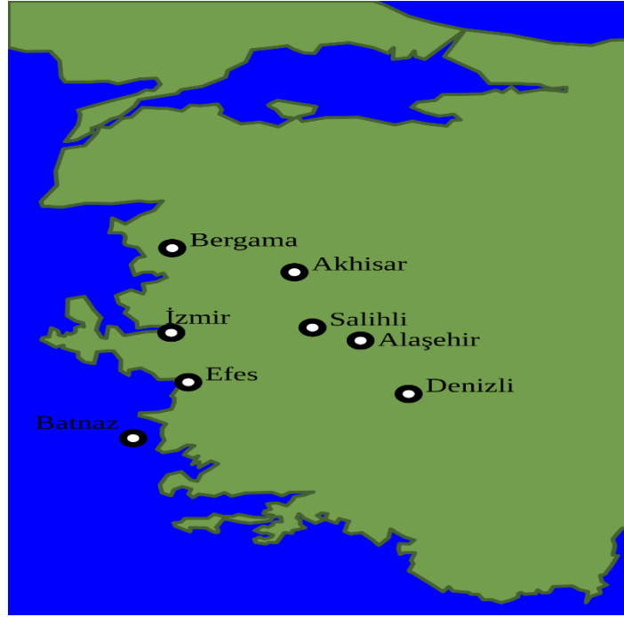
Şekil 5. Yedi Kilise ve Vahiy'in yazıldığı Patmos (Batnaz) Adası