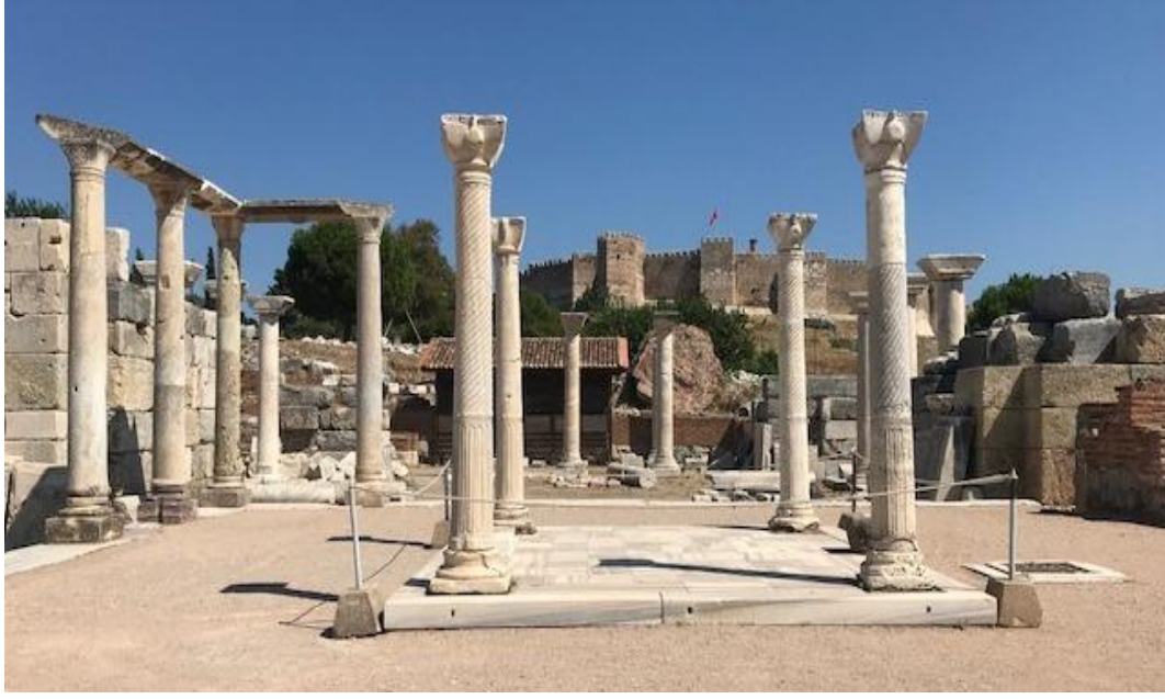
Şekil 1. Ayasuluk Tepesi, Selçuk, İzmir. Aziz Yuhanna'nın mezarı. Arka planda Selçuk Kalesi görünüyor (Not: Kendi çektiğimiz fotoğraflara ulaşamadığımdan internetten bir fotoğraf eklemek zorundayım.). https://www.arkeogezgin.com/ayasuluk-st-jean-kalesi/ (Erişim: 24.10.2020).