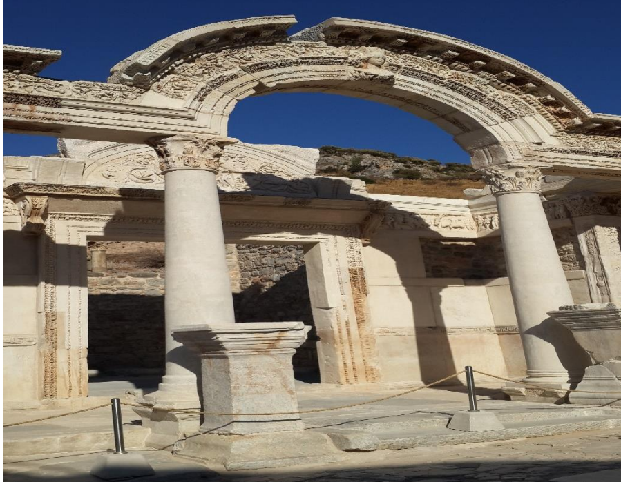
Şekil 3. Hadrianus Tapınağı, Efes (İ.S. 117-138), (Fotoğraf: Eylül, 2014)

Roma imparatorluğunun Asya eyaleti, yani Küçük Asya bu her iki çevreden de uzakta, özel konum ve özel koşulların sağladığı göreceli bir rahatlık içindeydi. Bu zenginlik ortamında ezilenlerin çok olması, tüm dünyanın bütün dinlerinin kaynaşıp karşılıklı hoşgörü ya da vurdumduymazlıkla bir arada bulunması, siyasal ayrıcalıklar ve baskı merkezlerinden göreceli uzaklık bu yeni dinin aynı kara parçası üstünde, Küçük Asya'da, yani Anadolu'da daha bir kolaylıkla yayılmasında ve ilk kilise topluluklarının oluşmasında rol oynamıştı.