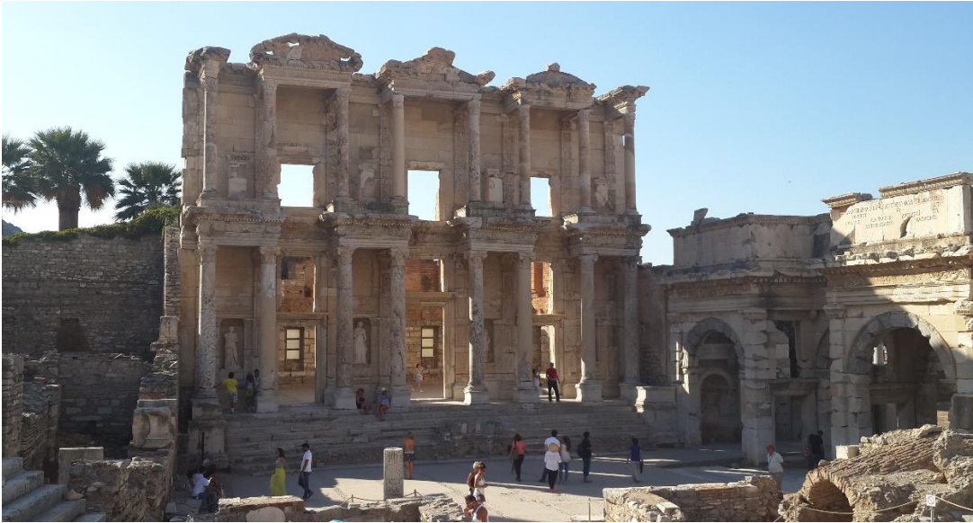
Şekil 4. Hadrianus Kapısı, Efes (İ.S. 117'de yapımı başladı. Üç katlı Dini Alay Yolu'nun Ortygia'ya giden sapağını gösterir), (Fotoğraf: Eylül, 2014).

Roma imparatorluğunun Asya eyaleti, yani Küçük Asya bu her iki çevreden de uzakta, özel konum ve özel koşulların sağladığı göreceli bir rahatlık içindeydi. Bu zenginlik ortamında ezilenlerin çok olması, tüm dünyanın bütün dinlerinin kaynaşıp karşılıklı hoşgörü ya da vurdumduymazlıkla bir arada bulunması, siyasal ayrıcalıklar ve baskı merkezlerinden göreceli uzaklık bu yeni dinin aynı kara parçası üstünde, Küçük Asya'da, yani Anadolu'da daha bir kolaylıkla yayılmasında ve ilk kilise topluluklarının oluşmasında rol oynamıştı.