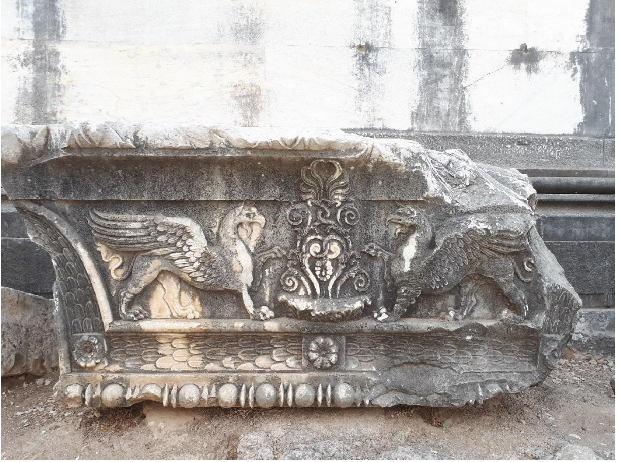
Resim 7. Didymaion avlusunda Griffon (Gryphon)* kabartmaları (19.09.2020)

* Griffon: Aslan vücutlu, kartal kanatlı ve kafalı mitolojik yaratık. Antik Yunanca'da, kıvrılmış, kırık anlamındaki " grýps veya gryphos " sözcüklerinden türediği düşünülür.