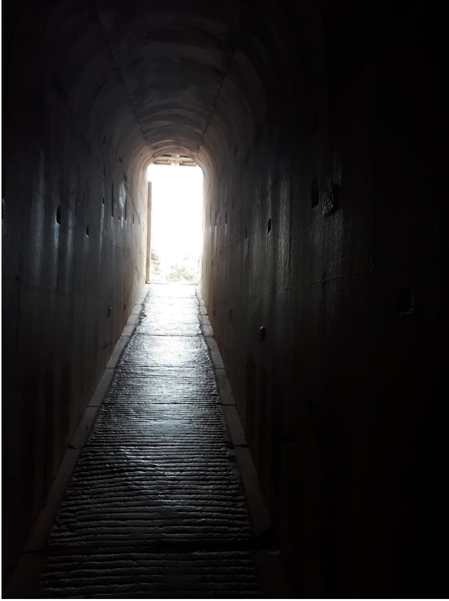
Resim 5. Didymaion’da sağı sollu bulunan iki dar, karanlık, dik tünelden biri (19.09.2020)