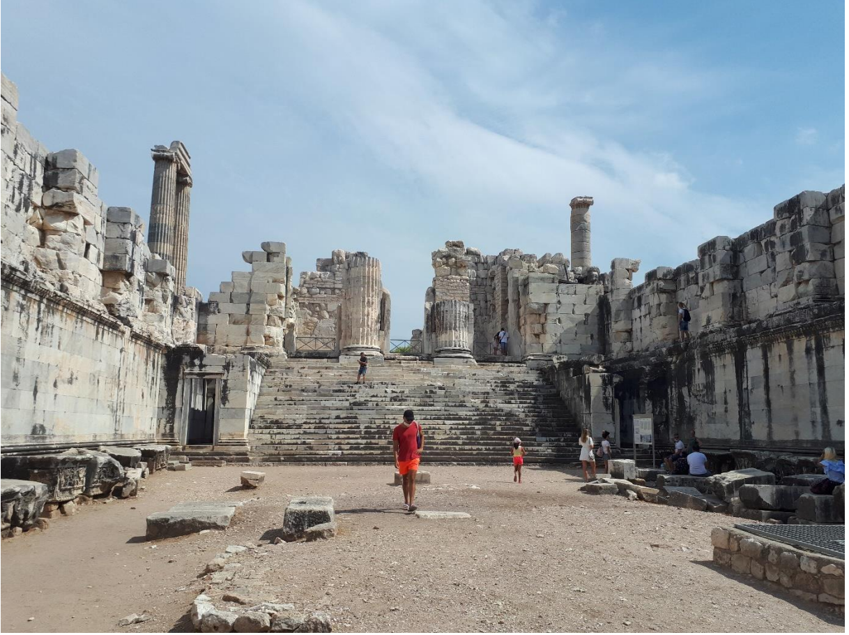
Resim 6. Didymaion adytum (avlu) (19.09.2020)

Adytum bölümünde taşların üzerinde Miletos ve Klaros'ta da gördüğümüz griffon kabartmalarına yine rastlarız.