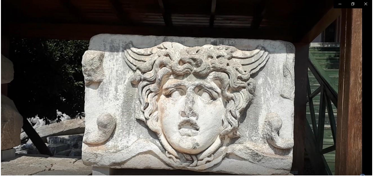
Resim 3. Didymaion'da Medusa Başı (Caput Medusa) (19.09.2020)