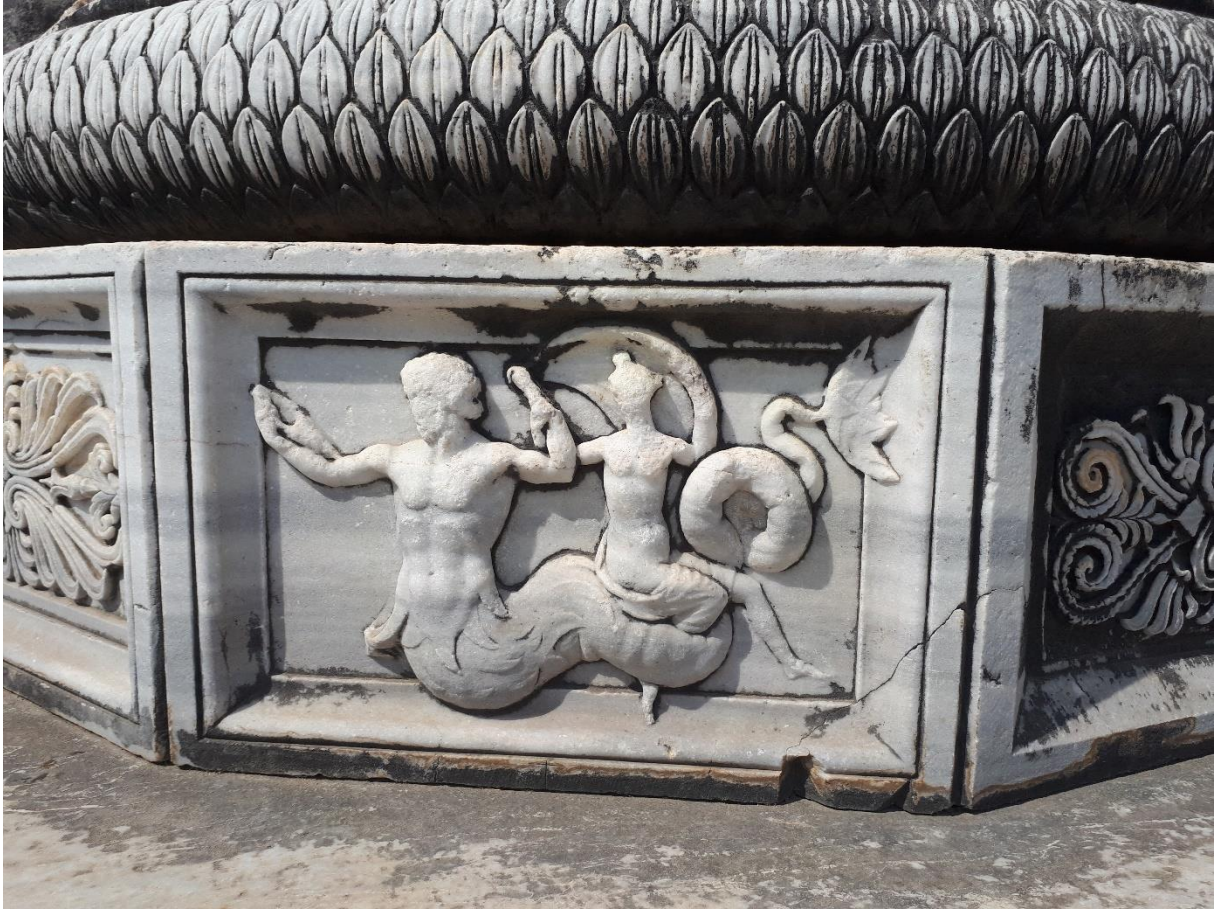
Resim 4. Didymaion Sütunlarından birinin tabanında alt tarafı balık olan bir adam figürü (Bir kadını bacağından yakalamış) (19.09.2020)