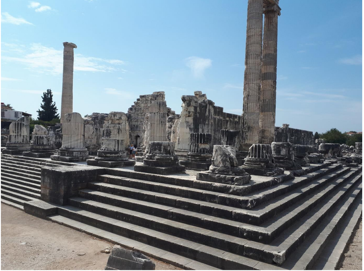
Resim 1. Didymaion (17.09.2020)