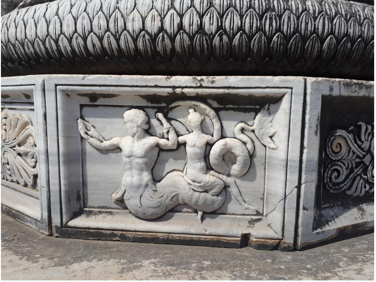
Resim 4. Didymaion Sütunlarından birinin tabanında alt tarafı balık olan bir adam figürü (Bir kadını bacağında yakalamış) (19.09.2020)