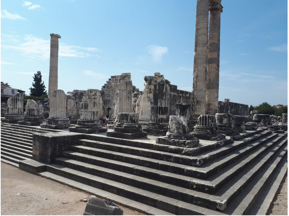
Resim 2. Dydimaion'dan bir görüntü (19.09.2020)