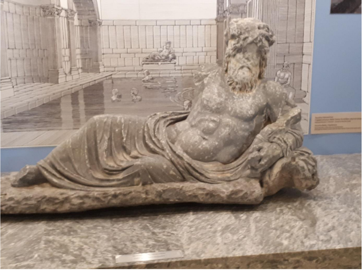
Resim 5. Miletos Müzesi'nde Nehir Tanrısı Meandros (12.09.2020)

Miletos'ta İlyas Bey Külliyesi de gezilebilir. Külliye'nin kitabesinden M.S. 1404'de Menteşeoğlu Emîri Şücâeddin İlyas Bey tarafından inşa edilmeye başlandığı anlaşılıyor. Külliye içerisinde iki hamam, imaret, medrese ve cami yer alıyor (Türkiye Diyanet Vakfı İslam Ansiklopedisi).