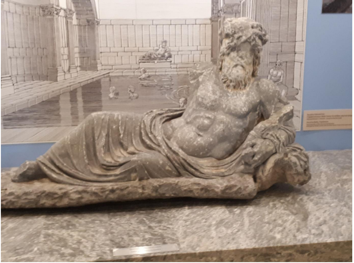
Resim 5. Miletos Müzesi'nde Nehir Tanrısı Meandros (12.09.2020)

Miletos'ta İlyas Bey Külliyesi de gezilebilir. Külliye'nin kitabesinden M.S. 1404'de Menteşeoğlu Emîri Şücâeddin İlyas Bey tarafından inşa edilmeye başlandığı anlaşılıyor. Külliye içerisinde iki hamam, imaret, medrese ve cami yer alıyor (Türkiye Diyanet Vakfı İslam Ansiklopedisi).