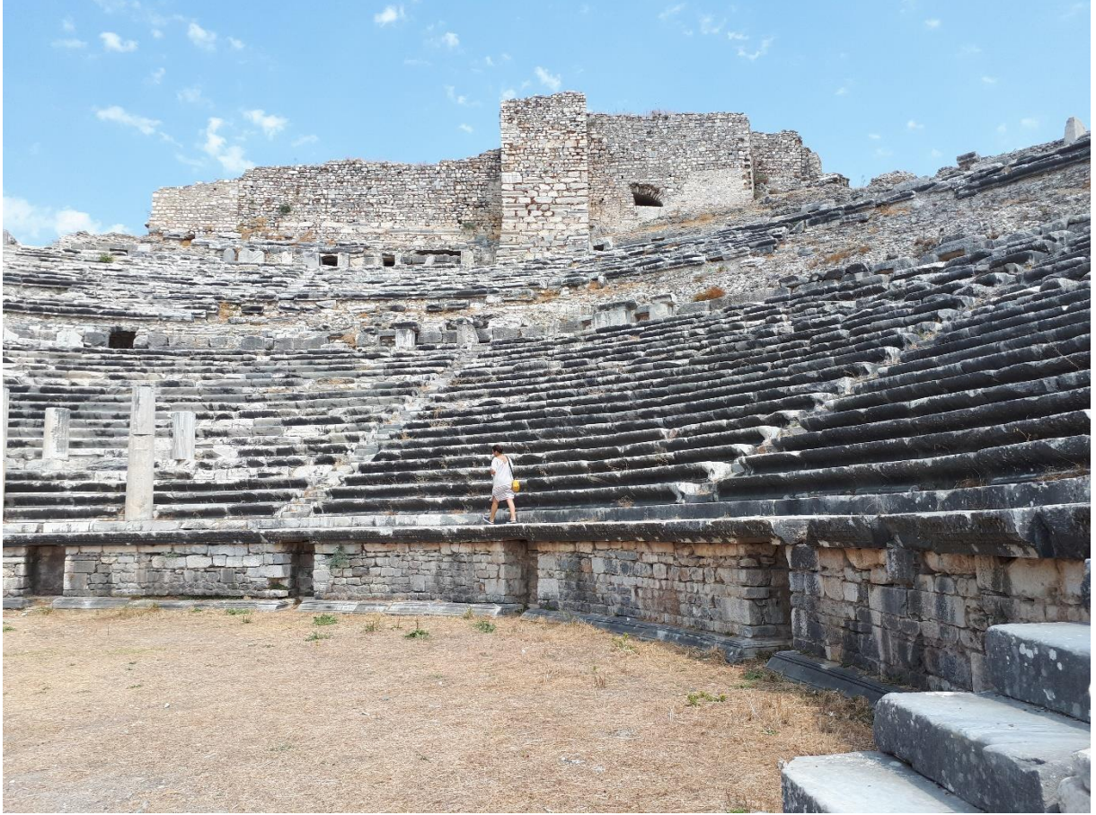
Resim 1. Miletos Antik Kenti, Tiyatro (12.09.2020)