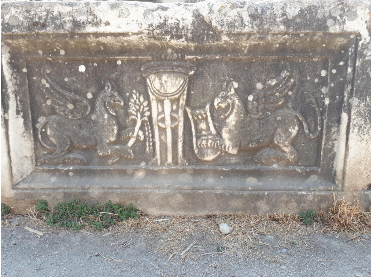
Resim 3. Miletos Tiyatro Girişinde Griffon (Gryphon)* kabartmaları (Bir griffon lyra** çalıyor, diğeri elinde çiçek taşıyor) (12.09.2020)

* Griffon: Aslan vücutlu, kartal kanatlı ve kafalı mitolojik yaratık. Antik Yunanca'da, kıvrılmış, kırık anlamındaki " grýps veya gryphos " sözcüklerinden türediği düşünülür.