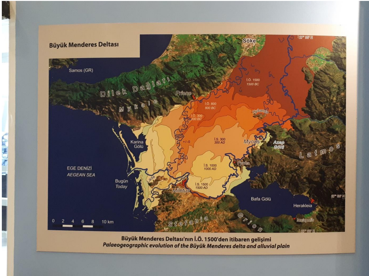
Resim 6. Miletos Müzesi, Büyük Menderes Deltası'nın İ.Ö. 1500'den itibaren gelişimi. Antik Miletos kenti bir liman şehriydi. Bugün ise denizden 10 km kadar içerde kalmıştır. (12.09.2020)