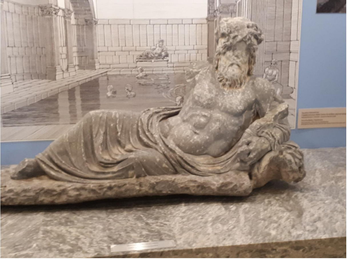
Resim 5. Miletos Müzesi'nde Nehir Tanrısı Meandros (12.09.2020)

Miletos'ta İlyas Bey Külliyesi de gezilebilir. Külliye'nin kitabesinden M.S. 1404'de Menteşeoğlu Emîri Şücâeddin İlyas Bey tarafından inşa edilmeye başlandığı anlaşılıyor. Külliye içerisinde iki hamam, imaret, medrese ve cami yer alıyor (Türkiye Diyanet Vakfı İslam Ansiklopedisi).