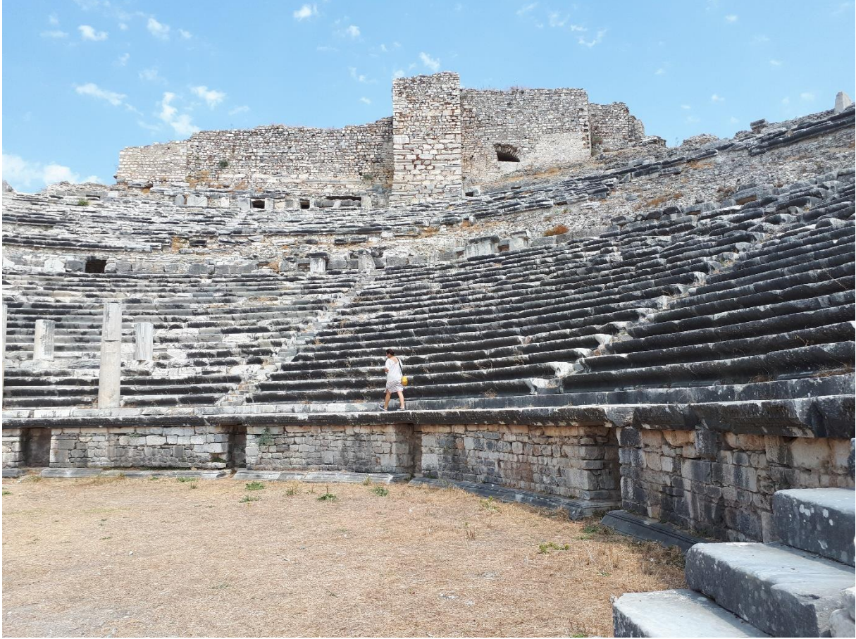
Resim 1. Miletos Antik Kenti, Tiyatro (12.09.2020)