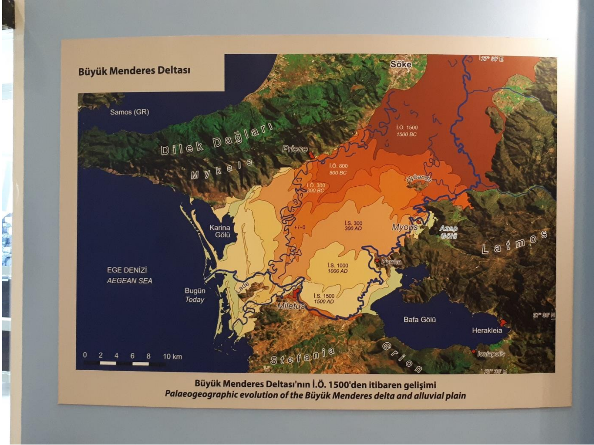
Resim 6. Miletos Müzesi, Büyük Menderes Deltası'nın İ.Ö. 1500'den itibaren gelişimi. Antik Miletos kenti bir liman şehriydi. Bugün ise denizden 10 km kadar içerde kalmıştır. (12.09.2020)