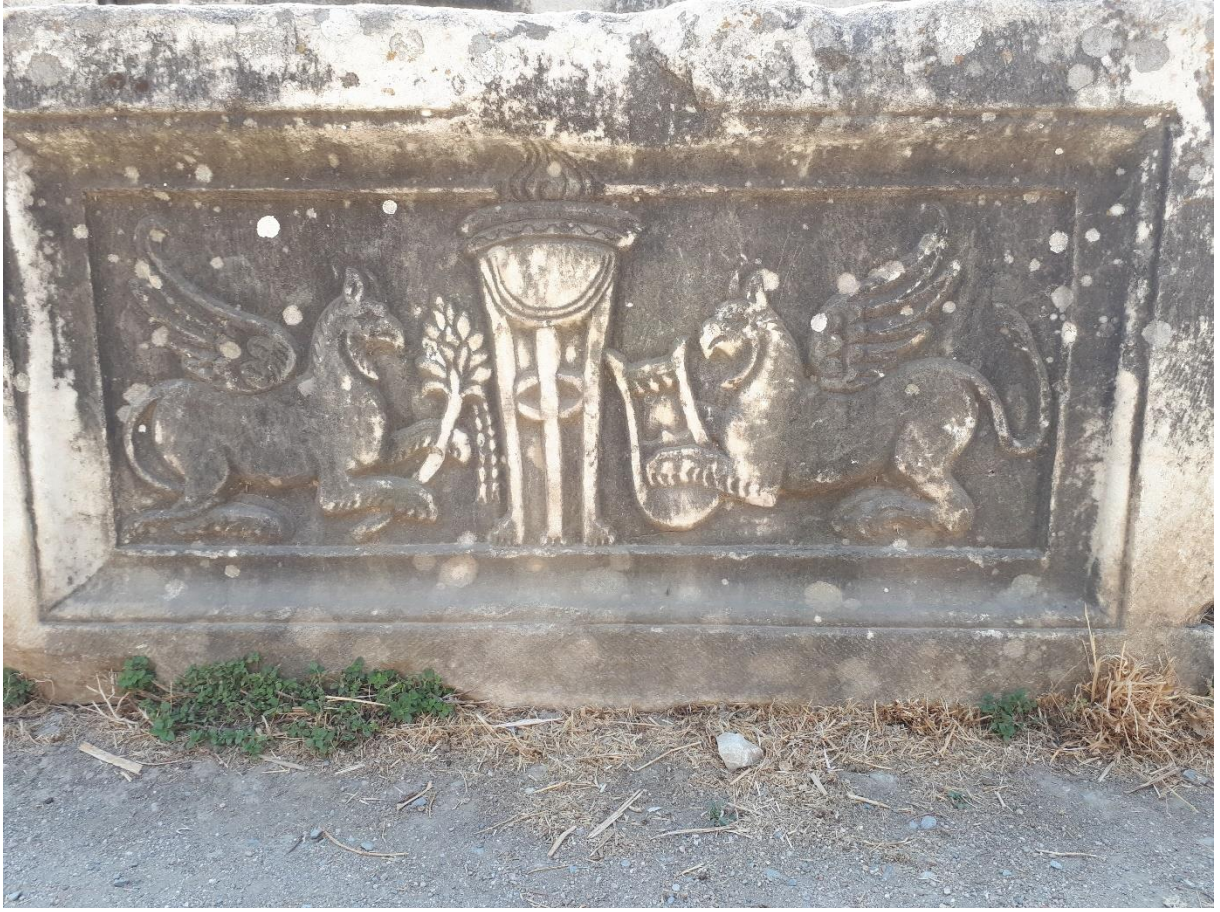
Resim 3. Miletos Tiyatro Girişinde Griffon (Gryphon)* kabartmaları (Bir griffon lyra** çalıyor, diğeri elinde çiçek taşıyor) (12.09.2020)

* Griffon: Aslan vücutlu, kartal kanatlı ve kafalı mitolojik yaratık. Antik Yunanca'da, kıvrılmış, kırık anlamındaki " grýps veya gryphos " sözcüklerinden türediği düşünülür.