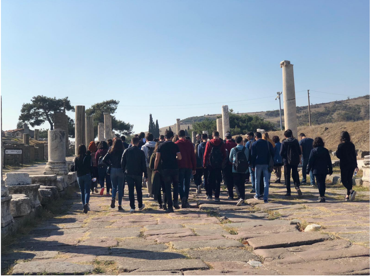
Resim 3. Bergama Asklepion girişi: Propylon (7 Kasım 2018)

Asklepion, adını Antik Yunan'ın sağlık tanrısı olan Asklepios'tan alan şifahane veya hastanelerdir.