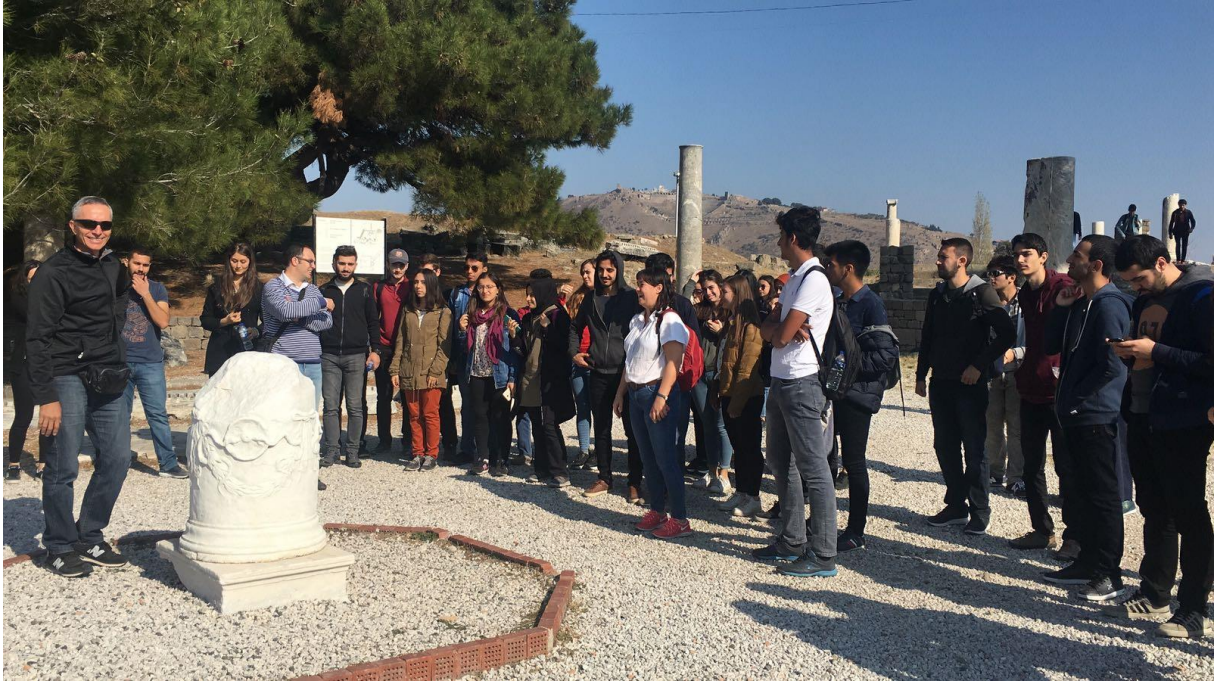
Resim 1. İKÇÜ Tıp Fakültesi Dönem 1 öğrencileri Bergama Asklepion'da (7 Kasım 2018)