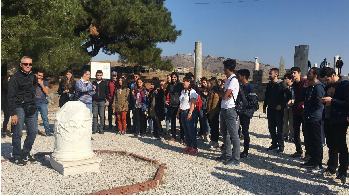
Resim 1. İKÇÜ Tıp Fakültesi Dönem 1 öğrencileri Bergama Asklepion'da (7 Kasım 2018)