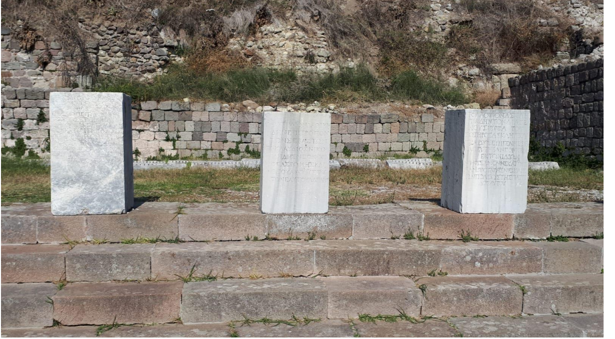
Resim 7. Asklepion Girişinde yer alan, iyileşenlerin teşekkür yazılarına örnekler (7 Kasım 2018)

Bu tedavi uygulamalarında şifanın sağlık tanrısı olan Asklepios'tan geldiğine inanılıyordu ve iyileşenler onun için sunak taşlarına teşekkür yazıları yazıyor ve hediyeler sunuyordu. Bu yazıları Asklepion'un girişinde görmek mümkündür (Ahmet Girgin; Akça & Uzel, 2018).