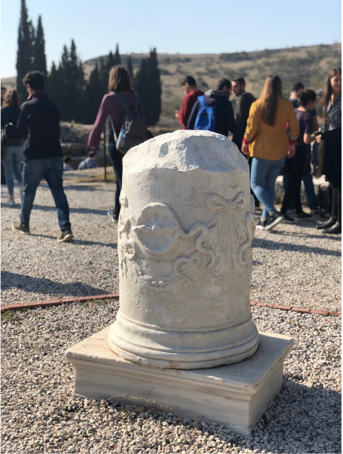
Resim 4. YILANLI SÜTUN (Aslı Bergama Müzesi'nde. Resimde görülen ve Asklepion'da bulunan ise replikası) (7 Kasım 2018)

“Asklepion'da bulunan bir kırık sütun üzerinde görülen kassenin etrafında iki yılan motifi, ölmek üzere olan bir hastanın iki yılanın zehrini içtikten sonra iyileştiği ile ilgili mitosunu konu alır ve daha sonra bir çubuğun etrafına dolanan iki yılan figürü tıbbın simgesi haline gelmiştir.”