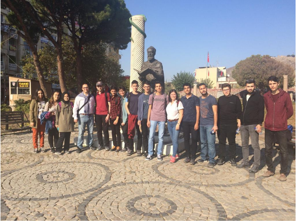
Resim 5. İKÇÜ Tıp öğrencileri Bergama merkezindeki Galen ve yılanlı sütun heykeli önündeler (7 Kasım 2018)