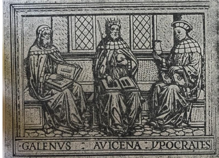
Şekil 2. İbn-i Sina'nın yazmış olduğu El Kanun-i fit-Tıb adlı eserinin 1510 da yayınlan Latince tercümesinin kapak fotoğrafı. Vefatından bir asır sonra Toledo'da Latince'ye çevrilmiştir. (1)

astronomi vb. birçok alanda yükselen bir figür olmuştur (Şekil 1) (2, 3) . Bir fizikçi, öğretmen ve araştırmacı olarak anatomiye katkıları Cladius Galen (MS. 120-200) ve Andreas Vesalius (MÖ. 1514-1564) arasındaki süreçte anatomik konularda çok önemli avantajlar sağlamıştır. İbn-i Sina'nın doğrudan insan diseksiyonuna girişip girişmediği tartışmalı olmasına rağmen, vücut yapıları hakkındaki çoğu tasviri 'kendi zamanının romanı' niteliğini taşımıştır. Bazı otoriteler İbn-i Sina'nın insan diseksiyonunu gizlice uyguladığına inanmaktadır (2, 3). El-Kanun fi't-Tıb'ın yazarı olarak, her bölümün başında o sistemin hastalığı üzerinden bir tartışmayla takip edilen sistemik bir yaklaşımla anatomiye tanıtmıştır. İbn-i Sina tarafından öncülük edilen bu yaklaşım, modern klinik yönelimli anatomi için kalıp olmuştur. Gözlerin genel prensiplerini öğrenmesi, hastalıkların farklı organlar üzerindeki etkileri analiz edilmesi ve öncelikle bu organların anatomisinin çalışılması gerektiği üzerinde durmuştur (4).