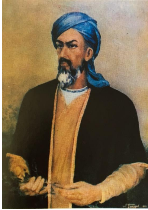
Şekil 1. Abu Ali Al-Hussein Ibn Abdullah Ibn Sina (MS. 980-1037) (1)

ABSTRACT: Abu Ali Al-Hussein Ibn Abdullah Ibn Sina, also known as Avicenna in the West, was one of the most superior Muslim physicians and philosophers of his time and his influence on Islamic and European medicine remained for centuries. Ibn Sina was born in 980 AD in the village of Afshanah near the city of Bukhara. He died in 1037 AD at the age of 57. He was buried in the city of Hamadan.