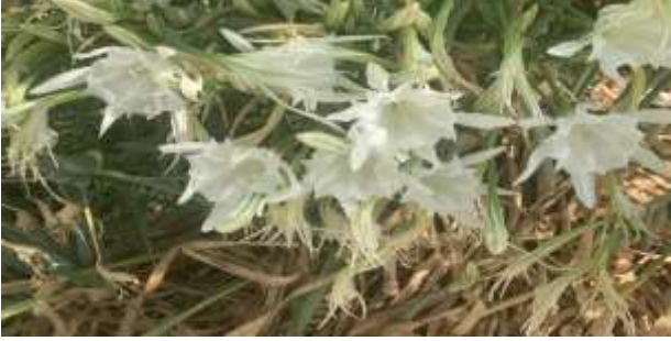
M. A. Akşit Koleksiyonundan