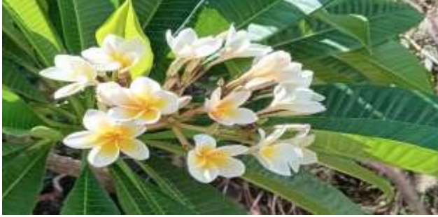
M. A. Akşit Koleksiyonundan