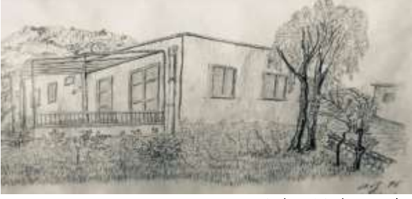
M. A. Akşit Koleksiyonundan