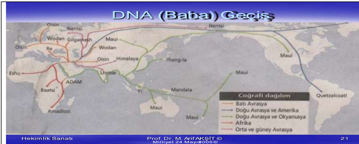
Şekil 5: İnsanların Evrene dağılımını DNA yapısı olarak kabile oluşumu, Kökeni 9