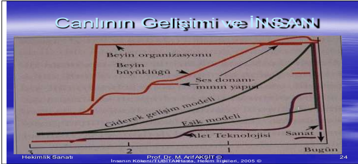
Şekil 8: İnsanların gelişimindeki, diğer canlılardan oluşan farklılaşması 7

İnsanın gelişimi boyutu olarak ele alırsak, aradaki değişim yapılanması