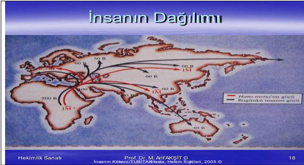
Şekil 2: İnsanların ilk dönem, Dünya ısınması ile Evrene dağılımı 7

Arkeolojik izlerin sürülmesi ile insanların göçleri gözlenmektedir