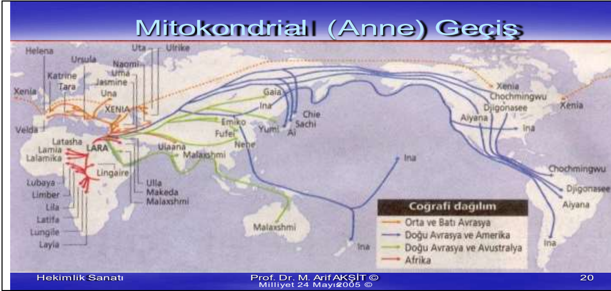
Şekil 4: İnsanların anne mitokondriyal Kökeni 9 (Milliyet 24 Mayıs 2005)

Genetik yapı olarak, Mitokondriyal RNA ile kadın temelde alınıp, kaçırılması yanında temel aile olarak yorumlanması ile kültür, toplum farklı toplumdan olsa bile, onlara göre yapılanmıştır.