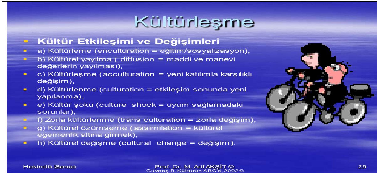
Şekil 9: İnsanlar tek bir kültüre aynen uyum değil, oluşan kültür etkileşimleri 10 (Güvenç, B. Kültürün ABC'si, 2002)

İnsanlar kültürlenme tanımında kapsayan yaklaşımları