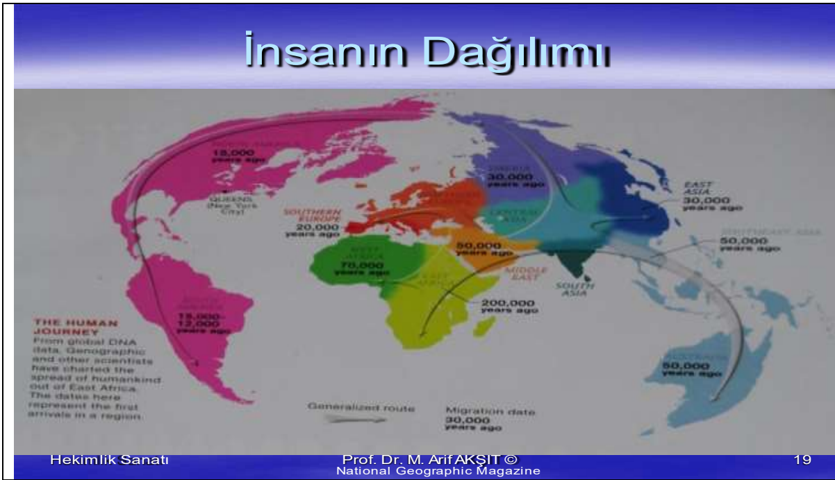
Şekil 3: İnsanların Dağılımı/Gruplaşması ile yaşanan değişimde kökenin izlemi 8 National Geographic Magazine

Yeryüzünde zamanla insanların kümeleştiği görülmektedir