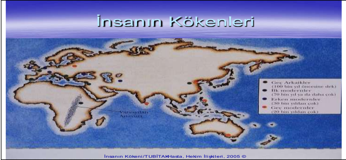
Şekil 1: İnsanların Kökeni 7 (İnsanın Kökeni, TÜBİTAK, Hasta Hekim İlişkileri, 2005)

Yeryüzündeki tarihi kalıntıların izleri sürülerek, kültürel odaklar gözlenmiş