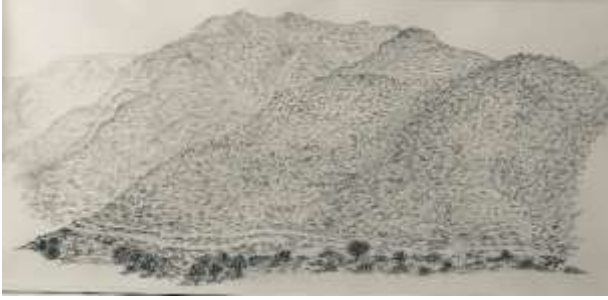
M. A. Akşit Koleksiyonundan