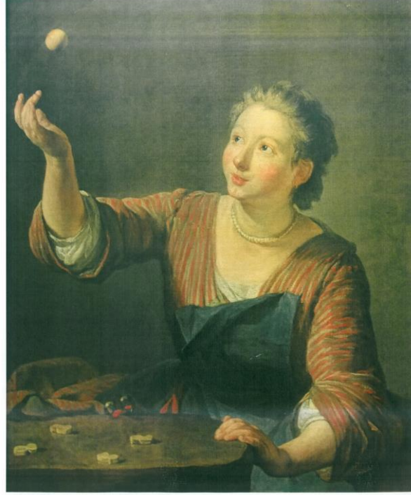
Şekil 7: Jean Baptiste Simeon-Chardin'in “Aşık Kemikleri” tablosu.