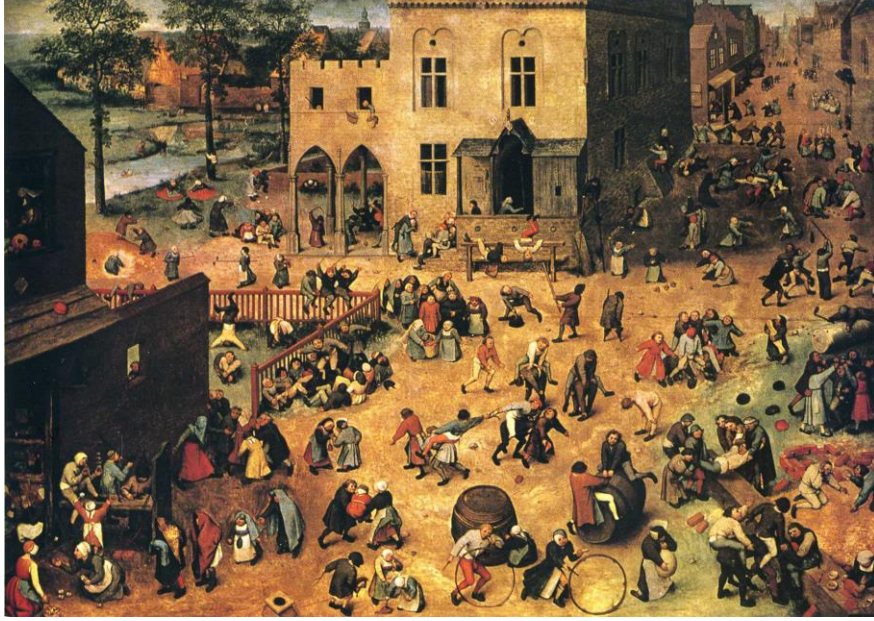
Şekil 6: (Yaşlı) Pieter Bruegel’in “Çocuk Oyunları” tablosu.

Hollandalı ressam (Yaşlı) Pieter Bruegel (1525-1569), 1560 tarihli “Çocuk Oyunları” (De kinderspelen) adlı tablosunda, o dönemde Hollanda’da oynanan çocuk oyunlarından 80 tanesini resmetmiştir. Resmin sol alt köşesinde, yaşları büyükçe iki kız, karşılıklı aşık oynamaktadır.