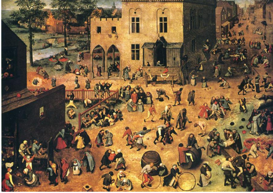
Şekil 6: (Yaşlı) Pieter Bruegel’in “Çocuk Oyunları” tablosu.

Hollandalı ressam (Yaşlı) Pieter Bruegel (1525-1569), 1560 tarihli “Çocuk Oyunları” (De kinderspelen) adlı tablosunda, o dönemde Hollanda’da oynanan çocuk oyunlarından 80 tanesini resmetmiştir. Resmin sol alt köşesinde, yaşları büyükçe iki kız, karşılıklı aşık oynamaktadır.