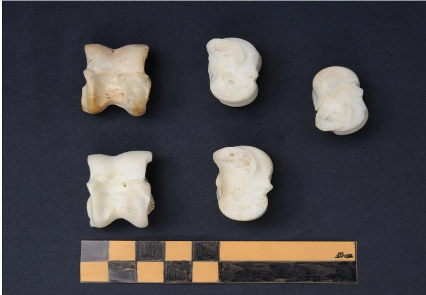
Şekil 1: Talus çeşitleri (Dandoy, 1996: 51 ve Fig. 3)

Aşık kemiği, talus ya da astragalus, tarsal bölgede bulunan bir kemiktir. Tibia ve fibulanın uzantısı olan malleolus medialis ve lateralis ile tarsus kemikleri içerisinde, altta calcaneus ve önde naviküler kemik ile eklem yapar. Talus ruminantlarda ise ; özellikle koyun, keçi ve geyik gibi hayvanlarda altı yüzlü, köşeli, küçük ve çok düzgün biçimlidir.