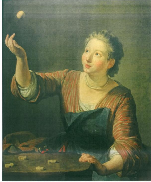
Şekil 7: Jean Baptiste Simeon-Chardin'ın “Aşık Kemikleri” tablosu.