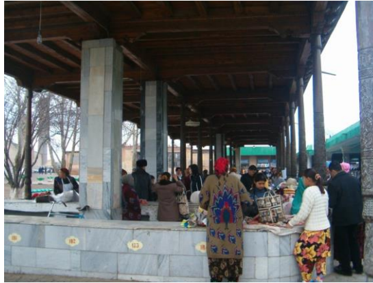
Pazaryerinden bir görünüş

Türbenin yanında Pazar yeri bulunuyordu.