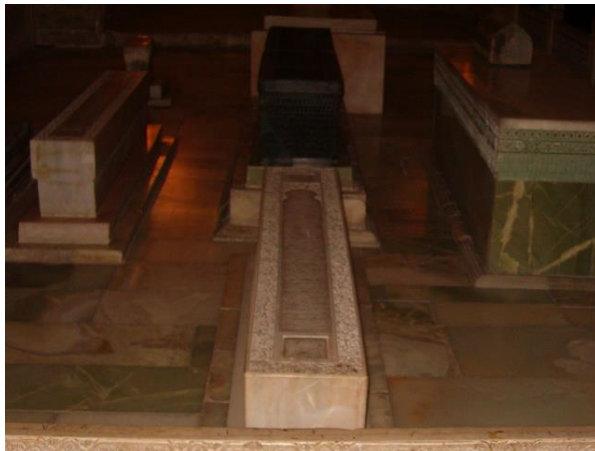
Emir Timur'un mezarının içi

Emir Timur türbesinde, hocasının ayaklarının altında yatmaktadır.