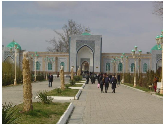
İmam Buhari Külliyesinin girişi

Taşkent'ten kiraladığımız özel araçla yola koyulduk. Çift şeritli yol bazı kısımları hariç çok düzgündü. Bir süre nehrin kenarından yol aldık. Bazen yolumuza tren yolu eşlik ediyordu. Uzun katarlarıyla yolcu ve yük trenleriyle selamlaşıp yolumuza devam ettik. Yolda bir çay bahçesinde kahvaltı yaptık. İlk durağımız şehre on kilometre mesafedeki Jamboy yerleşim birimiydi. Buradaki fabrikada işim 3-4 saat sürdü. Arada öğle yemeği yedik. Sonra ver elini İmam Buhari'nin türbesi deyip Jamboy'dan ayrıldık. Yaklaşık 20 kilometrelik bir yolculuktan sonra İmam Buhari'nin türbesine ulaştık. Türbe Semerkant-Buhara yolu üzerindeki Hertenk köyündedir.