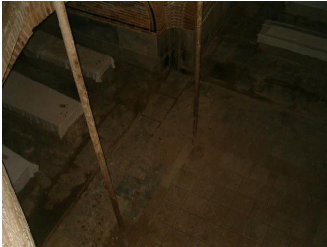
Türbenin içinin görünüşü

İlginç bir öyküsü var bu külliyenin. Bibi Hatun Timur'un gözdesidir. Emir Timur bu yapının mimarını idam ettirmiş. Öykü ilginç, mimar bir türlü külliye bitirmez. Bibi Hatun, mimarı çağırıp gecikmenin sebebini sorar. Mimar, "Size âşık oldum, sadece sizi bir kere öpmek istiyorum" der. Bibi Hatun mimara, "Sana en güzel cariyemi vereyim. O olmazsa seni hakanlığın en güzel kızıyla evlendireyim. İste seni altına gark edeyim". Mimar hiçbirini kabul etmez. Bibi hatun sonunda bir çözüm bulmuş, dudaklarının önüne bir cam koymuş. Dudaklar camda buluşmuş. Emir Timur seferden döner dönmez ilk iş olarak mimarın boynunu vurdurmuş.