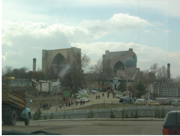
Bibi hatun Külliyesi'nin uzaktan görünüşü

Kalacağımız yarı otel, yarı pansiyon, iki arabanın zar zor geçebileceği dar bir sokaktaydı. Sabah kahvaltıdan sonra yakınımızdaki Bibi Hatun Külliyesi'ni dolaşmaya başladık.