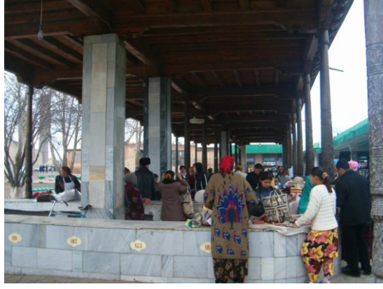
Pazaryerinden bir görünüş

Türbenin yanında Pazar yeri bulunuyordu.