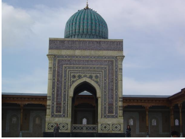
İmam Buhari Türbesi

Özbekistan bağımsızlığa kavuşunca Devlet Başkanı İslam Kerimov muhteşem bir türbe ve külliye yaptırmış.