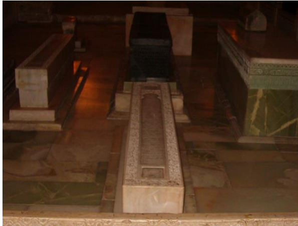
Emir Timur'un mezarının içi

Emir Timur türbesinde, hocasının ayaklarının altında yatmaktadır.