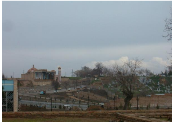
Hazreti Hızır Camii

Bu klliye Hazreti Muhammed'in amcası Hazreti Abbas'ın kk oėđu Hsam iin yapılmıŐ. Trbesi bu klliye deydi. Kırk ksur basamakla ıkılan bir tepedeydi. nndeki dzlkte byk ocaklar ve yıkılmıŐ kk fırın kalıntıları bulunuyordu. Daha nceleri burada piŐirilen yemek ve ekmekler-patern denen bir eŐit bir pide- ihtiyaı olanlara daėıtılıyormuŐ. Sylentiye gre basamakları kırka kadar sayıp ıkanın gnahları affolunuyormuŐ. Komplekste bir cami, medrese, eŐitli odalar, Timur soyundan gelen hanların, prens ve prenseslerin gml olduėu trbeler ve mezarlar vardı. Klliyeinin yakınında Hazreti Hızır Camii bulunuyor.