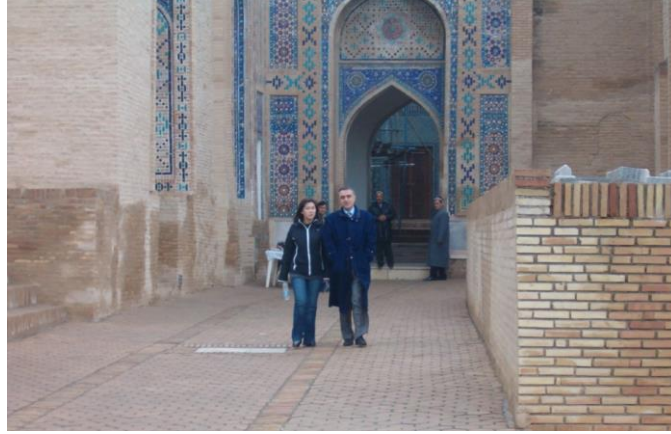
Külliye'nin içinden bir görünüş