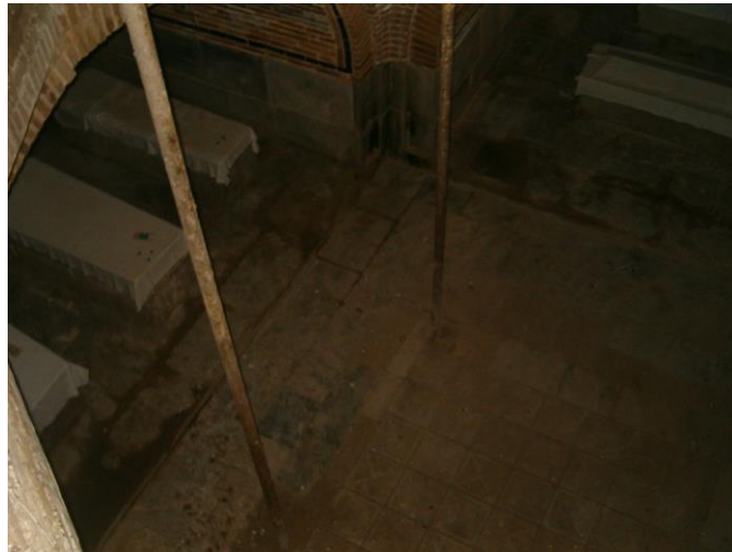
Türbenin içinin görünüşü

İlginç bir öyküsü var bu külliyenin. Bibi Hatun Timur'un gözdesidir. Emir Timur bu yapının mimarını idam ettirmiş. Öykü ilginç, mimar bir türlü külliye bitirmez. Bibi Hatun, mimarı çağırıp gecikmenin sebebini sorar. Mimar, "Size âşık oldum, sadece sizi bir kere öpmek istiyorum" der. Bibi Hatun mimara, "Sana en güzel cariyemi vereyim. O olmazsa seni hakanlığın en güzel kızıyla evlendireyim. İste seni altına gark edeyim". Mimar hiçbirini kabul etmez. Bibi hatun sonunda bir çözüm bulmuş, dudaklarının önüne bir cam koymuş. Dudaklar camda buluşmuş. Emir Timur seferden döner dönmez ilk iş olarak mimarın boynunu vurdurmuş.