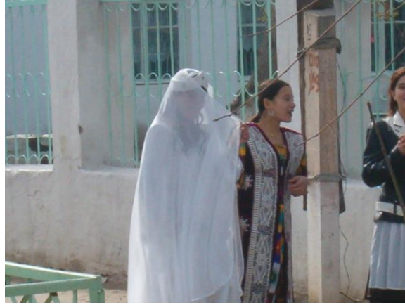
Bayrama hazırlanan öğrenciler

İkinci gidişim ağustos ayı sonlarıydı. Sokaklarda öğrenciler bizdeki 23 Nisan şenliklerinde olduğu gibi rengârenk elbiseler içindeydiler. Sokaklar süslenmişti. Arabadan indim birkaç fotoğraf çektim.