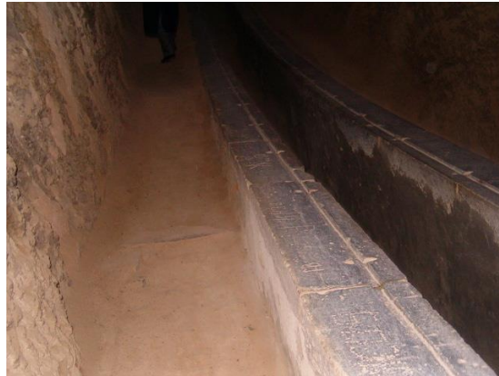
Rasathanenin içi yanlardaki mermerlerin üzerinde yıldızlar kazılı

Aynı zihniyetteki mollalar İstanbul'da Takiyuddin adlı bilginin bugünkü Galatasaray semtinin olduğu yerde kurduğu gözlemevinin yıkılmasını istediler ve başardılar. 19.y.yılın sonlarında meraklı bir Rus general bu gözlemevini araştırır. Bulur ve restore eder. Uluğ Bey için rasathanenin hemen yanında küçük bir müze yapılmış. Tavanında gökyüzünün yer aldığı. Rasathanenin merdivenlerinden aşağı inerken rehberimiz şu bilgiyi verdi "Merdivenin kenarındaki mermerlerin üzerinde her basamağın karşısında bir yıldız vardır". Gece göğün ışığı o an görünen yıldız düşermiş.