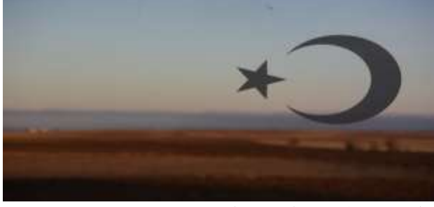
M. A. AKŞİT Koleksiyonundan/Collection