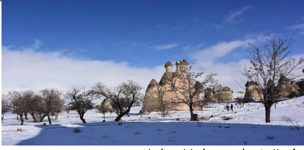
M. A. Akşit Koleksiyonundan/Collection