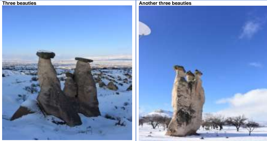
Figure 2: The two kind of three beauties of the fairy chimneys