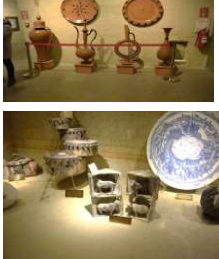
Figure 4: In general the sun of the Hittites as Wine bottle/cup (M.A. Akşit Photo album 4 )