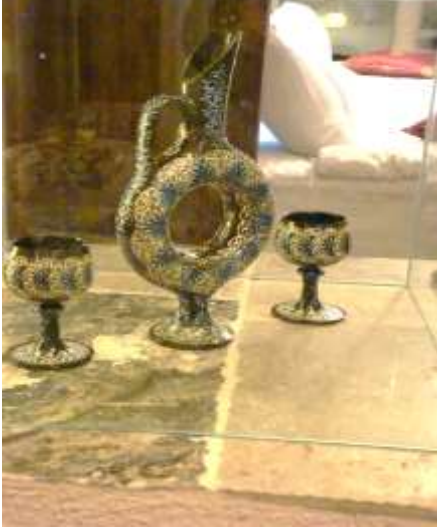
The hotel owner production, seen in the room