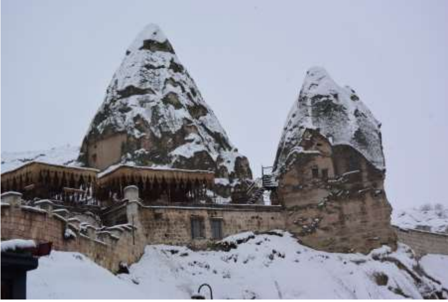
M.A. Akşit Photo album*/Collection