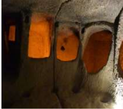
Toplu kişiler için toplanılan yer