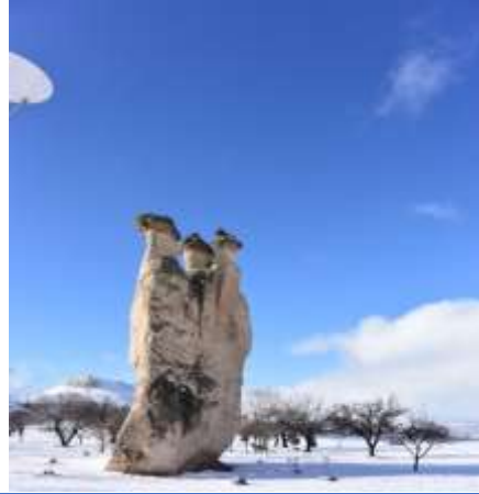
Figure 2: The two kind of three beauties of the fairy chimneys