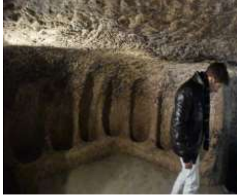
Figure 3: The room and connection others, and a church with seats