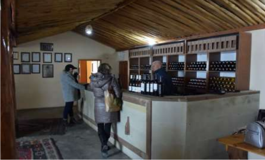
Figure 5: From the photo at the wine producer