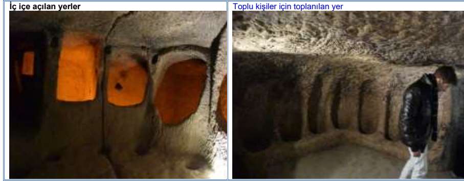
Şekil 3: Yer altı şehri ve Kilise yapısı