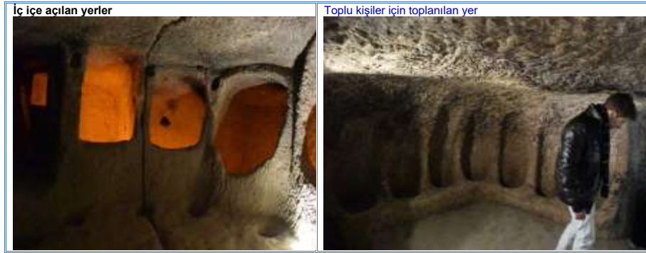
Şekil 3: Yer altı şehri ve Kilise yapısı