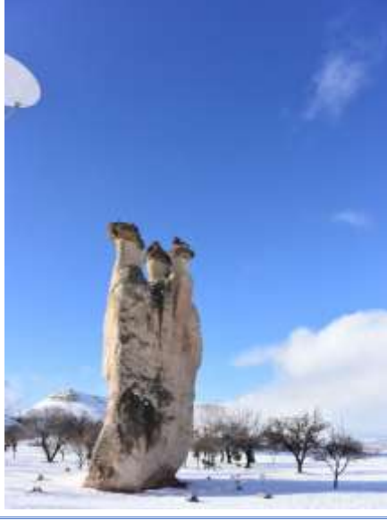
Şekil 2: Üç güzeller Peri Bacaları (M.A. Akşit Koleksiyonundan 4 )