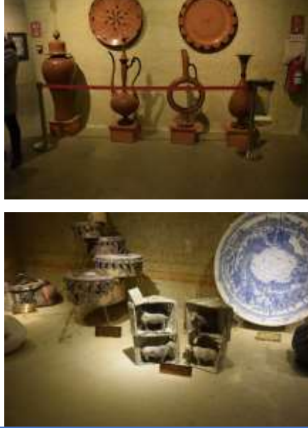
Şekil 4: Genel olarak Hitit Güneşi Şarap Şişesi (M.A. Akşit Koleksiyonundan 4 )