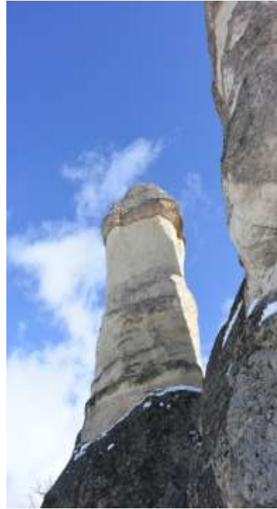
M. A. Akşit Koleksiyonundan/Collection