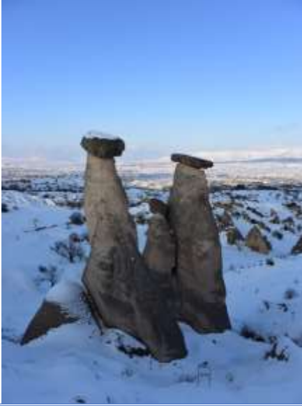
Başka bir üç güzel