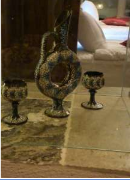
Otel sahibinin yaptığı otele süs olarak konulan eserler