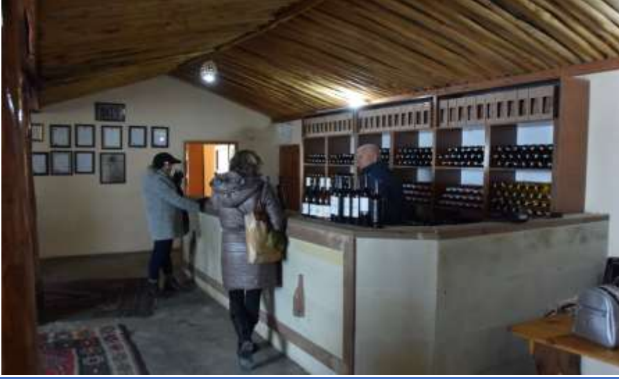
Şekil 5: Şarap imalathanesinden resim

Duvardaki çerçeveli olanlar, aldıkları ödüllerdir.