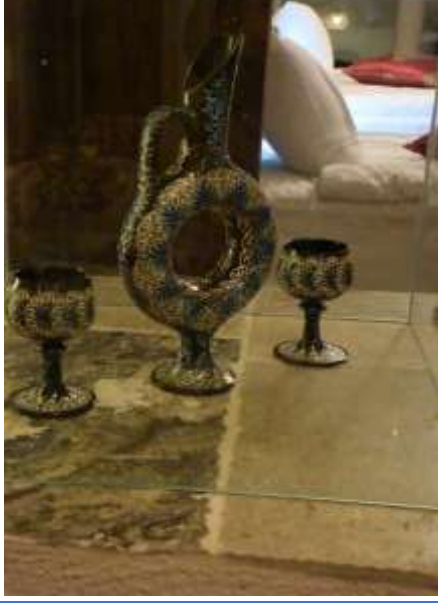
Otel sahibinin yaptığı otele süs olarak konulan eserler