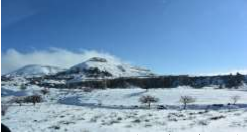
M. A. Akşit Koleksiyonundan/Collection