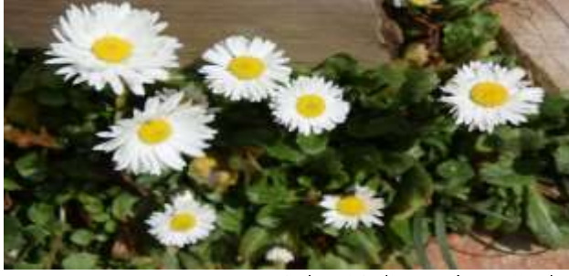
M. A. Akşit Koleksiyonundan/Collection