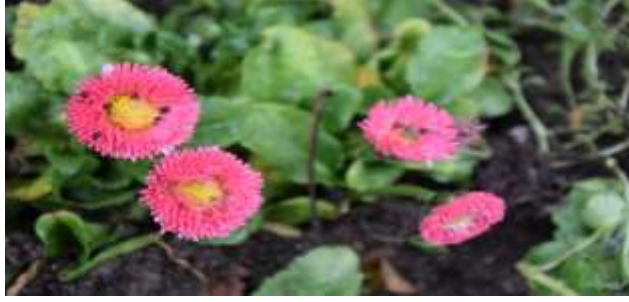
Bellis perennis