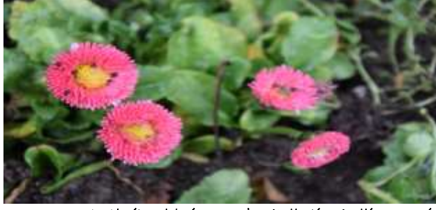
M. A. Akşit Koleksiyonundan/Collection/Bellis perennis